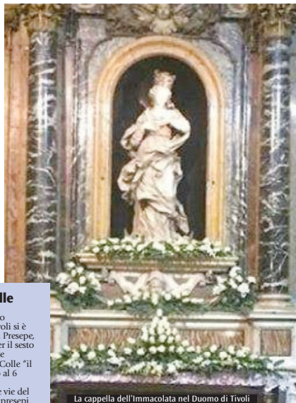
La cappella dell'Immacolata nel Duomo di Tivoli

Un rione del borgo medievale di Tivoli si è "trasformato" in Presepe, da ieri, 16 dicembre. Per il sesto anno consecutivo, viene proposta l'iniziativa al Colle "il rione dei presepi". Fino al 6 gennaio, il comitato di quartiere trasformerà le vie del Colle in una mostra di presepi. La sua presenza nelle case rappresenta ovunque la nascita di Dio bambino, una nascita che ci dà l'opportunità di tornare a nascere in amore e saggezza. I volontari del rione del Colle, il presepe lo hanno pensato "in finestra", non rivolto nella propria casa ma verso l'esterno, verso tutti, in segno di apertura e di condivisione. Più di venti scuole di tutti i gradi e indirizzi della città di Tivoli hanno partecipato alla realizzazione di presepi che sono allestiti nelle finestre delle cantine e in altri luoghi suggestivi del quartiere (androni, pontoni...). Un'occasione unica per vivere una parte della città storica come non si è mai vista. I presepi rimarranno visibili per tutte le festività natalizie sino al 6 gennaio. Durante questo fine settimana, i visitatori potranno gustare, nel pomeriggio, dolci, cioccolata, vin brulé e pizza fatta nel forno rionale, oltre a momenti musicali ed esposizioni artigianali.