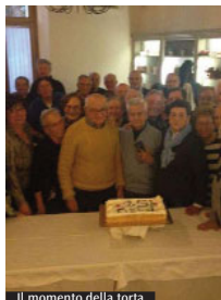
Il momento della torta

Medicus di Tivoli. GIOVEDÌ 21 DICEMBRE alle 18.30, presso la parrocchia di Cristo Re in Marcellina, incontra la comunità diocesana del diaconato permanente. VENERDÌ 22 DICEMBRE alle 12, nella Sala Favari della Curia vescovile scambia gli auguri con i sacerdoti, consacrate e fedeli laici della Curia e degli altri organismi di partecipazione diocesana in occasione del Natale; alle 17, presso la casa San Giovanni Paolo II, incontra la rappresentanza degli educatori e degli iscritti all'Azione Cattolica diocesana per uno scambio di auguri natalizi. DOMENICA 24 DICEMBRE alle 23.30, in Cattedrale, presiede l'Ufficio delle Letture e alle 24 celebra la Messa di Mezzanotte nella Solennità del Natale di Nostro Signore Gesù Cristo.