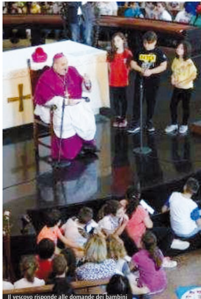
Il vescovo risponde alle domande dei bambini

D omenica prossima, alle 9.30, i fedeli di Tivoli accoglieranno l'immagine della Madonna di Quintiliolo presso l'Arco di Quintiliolo prima dell'ingresso solenne in città al Ponte Gregoriano. Alle 10, nella chiesa di San Biagio, monsignor Parmeggiani presiederà la Messa concelebrata dai sacerdoti di Tivoli prima della processione per raggiungere la Cattedrale.