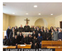
Le suore e il vescovo a Pozzaglia

L laboratorio teatrale diocesano, da ormai più di dieci anni, si propone di raccogliere i giovani della diocesi di Tivoli appassionati di teatro e di arti performative per un obiettivo comune: fare qualcosa di bello e costruttivo insieme, fare comunità, insomma, fare famiglia. L'ultimo capitolo di questo lavoro che l'Ufficio dei Talenti, questo il nome della compagnia, cerca di portare avanti è la replica, andata in scena sabato 14 aprile presso la parrocchia Madonna della Fiducia di Tivoli e domenica 15 aprile presso la chiesa parrocchiale di San Pietro Apostolo a Vicovaro. Per chi volesse seguire o contattare l'Ufficio dei Talenti, è disponibile la pagina facebook, il canale YouTube e il sito internet ( http://ufficiodeitalenti.weebly.com ).