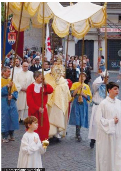
La processione eucaristica