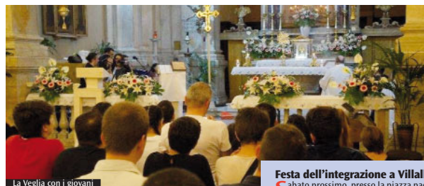
La Veglia con i giovani