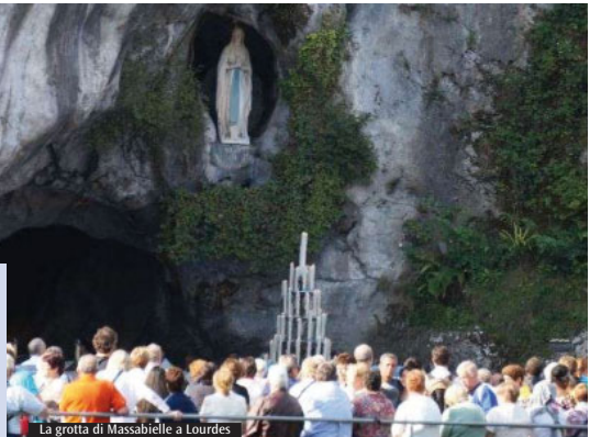
La grotta di Massabielle a Lourdes

spirituale. Durante queste apparizioni a Bernadette, presso la Grotta di Massabielle, la Vergine si è presentata come l'Immacolata Concezione. Una formula che era stata proclamata Dogma della Chiesa da parte di papa Pio IX l'8 dicembre 1854, ma che la semplice Bernadette non poteva conoscere, essendo incolta.