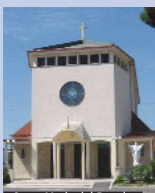
Santa Maria del Popolo

Alle 16, inaugura la nuova rampa per disabili presso la sede del Centro integrazione sociale (Cis) nel