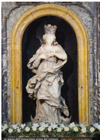
La statua dell'Immacolata prima del restauro

la celebrazione. Nella solennità dell'Immacolata si rinnova il voto della città, mai interrotto dal 1656