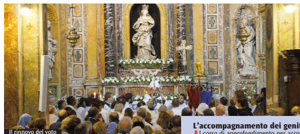
Il rinnovo del voto