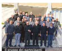
Il gruppo dei partecipanti

10,8)" è stato condotto da monsignor Agostino Superbo, arcivescovo emerito di Potenza - Muro Lucano - Marsico Nuovo, non solo rifacendosi al metodo classico della Lectio divina ma anche con riferimenti chiari e concreti alla vita pastorale quotidiana. È proprio questa la dimensione di una vera spiritualità presbiterale: attualizzare nella vita di tutti i giorni, nei suoi chiaroscuri, la dimensione dello spirito, del legame con il soprannaturale. I temi della preghiera, dell'accoglienza, dell'andare alla ricerca dei fratelli con la bisaccia piena di misericordia, della gratuità sono stati motivati da brani biblici, dalla