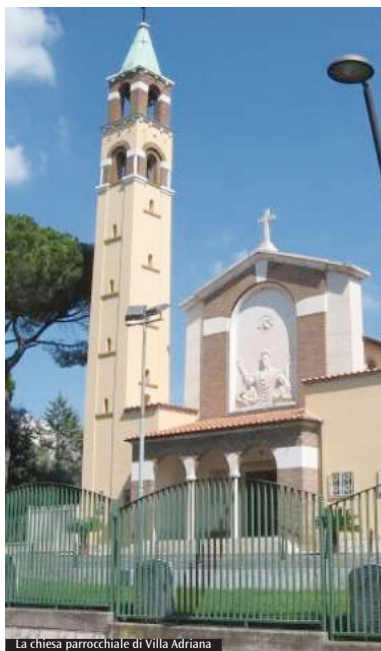
La chiesa parrocchiale di Villa Adriana